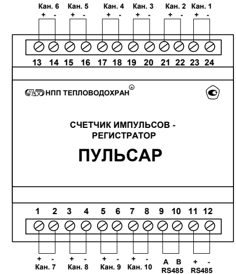
Рис. 6 Схема клеммников счетчика

Подключение активных выходных цепей должно производиться при отсутствии напряжения питания.