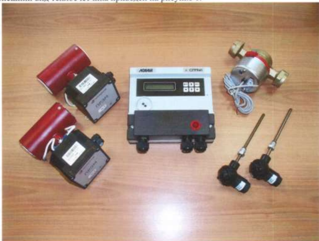
Рисунок 1 – Внешний вид теплосчетчика

Внешний вид теплосчетчика приведен на рисунке 1.